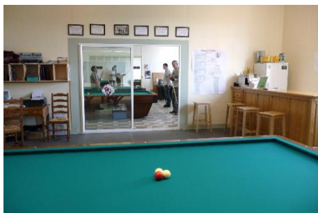
Salle Gymnase Guy IV